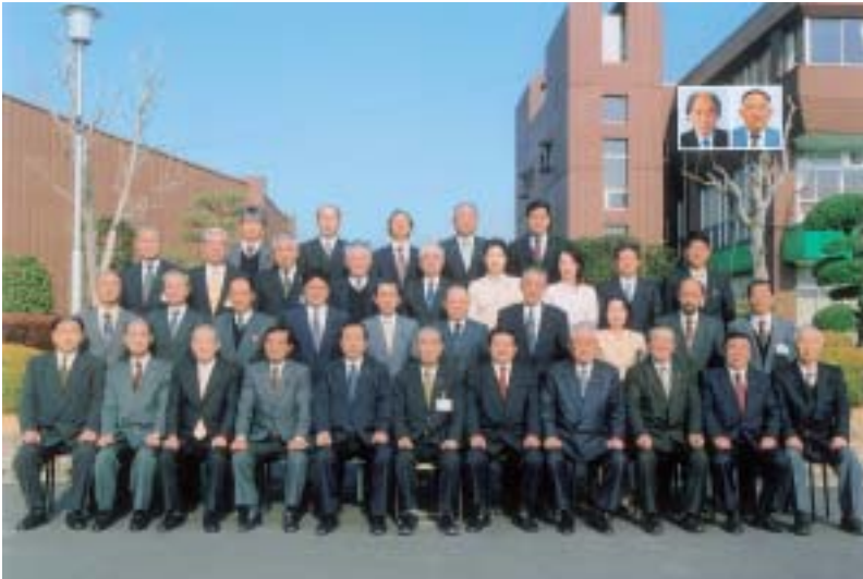
那珂川町議会議員（在任特例18.4.30まで）及び執行部

議場、議会事務局が小川庁舎に移転しました。 住所 那珂川町小川2814番地1 電話 0287（96）2112