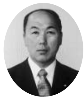
川上 要一 議員

質問 職員の提案制度については、財政がきわめて逼迫した中での町政の執行、まことに困難の極みである。その中で行政サービスを低下させずに生き生きとした町づくりのために執行部を中心に全職員の英知を結集しなければならぬ。