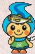
町のイメージキャラクター 「なかちゃん」