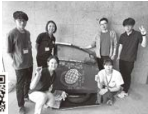
「こくばんくるま」インスタグラム

7月に入ってから「こくばんくるま」の活動に参加させていただいています。「こくばんくるま」とは町内の事業者さんが、車の外装やドアを黒板に加工し、絵や文字を描けるように制作したものです。道の駅ばとう等に設置されているので、ご覧になっている方も多いかと思えます。「こくばんくるま」は町内各所に設置してあるだけでなく、有志の方々がインスタグラムで、1000日毎日投稿チャレンジをされています。地域おこし協力隊も全員で仲間に加えていただき、定期的に絵を描いているので、ぜひ「こくばんくるま」のインスタグラムをご覧ください。また、誰でも好きに書き込める「こくばんドア」を役場正面玄関に設置しておりますので、近くにお立ち寄りの際には、ぜひイラストや皆さんだけの記念日など、自由に書き込みをしていただきたいと思いますね。