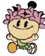
棚倉町シンボルキャラクター「たなちゃん」

秋には、お堀を囲むように木々が色鮮やかに紅葉し、美しく飾られる城跡が楽しめます。また、追手門跡付近に佇む推定樹齢640年の大ケヤキは、棚倉町のシンボルとなっています。