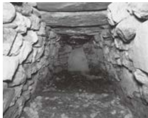
川崎古墳 石室内 昭和43(1968)年3月13日指定