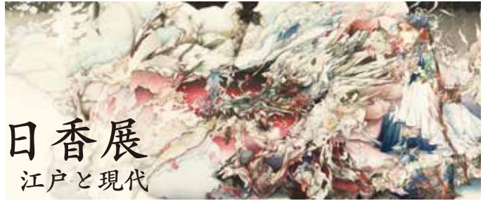
入江明日香《黒雲妖炎龍図》丸沼芸術の森蔵