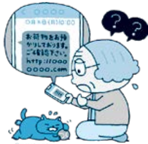
(独)国民生活センター「見守り新鮮情報」より

もし身に覚えのない不在通知が届いても、むやみにアクセスしないでください。困った時は消費生活センターにご相談ください。