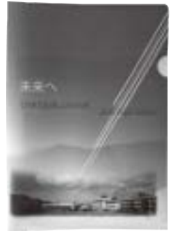
〈新規：馬頭高クリアファイル〉

吹奏楽部の演奏でお迎えし、生徒会が中心となって行った全体会では、昨年度に引き続き、出演・撮影・編集のすべてを生徒が行った動画による学校紹介、本校普通科ならではの選択科目である農業と環境の発表、そして水産科からは河川環境を研究している課題研究班による発表を行いました。動画による学校紹介は、生徒目線で馬頭高校の日常が紹介され、普通科・水産科それぞれの発表においても、パワーポイント等を使い各科の魅力が伝わる分かりやすい発表で、中学生に馬頭高校の特色や学校生活の楽しさを感じていただけたと思います。