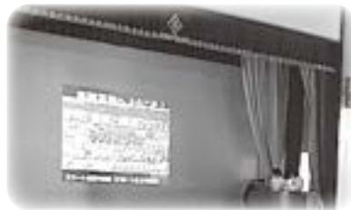
〈選択科目農業と環境の発表〉