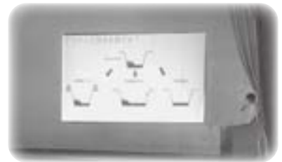
〈水産科の研究発表〉

全体会の後は普通科と水産科に分かれ、普通科は、数学・理科・英語の体験学習および保護者説明会を、水産科は、実習場へ移動して施設見学と説明会が行われました。体験後のアンケートでは「とても分かりやすかった」「魅力的な学校で入学したい」等、とても好評な1日でした。