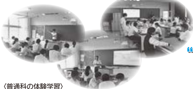
〈普通科の体験学習〉

全体会の後は普通科と水産科に分かれ、普通科は、数学・理科・英語の体験学習および保護者説明会を、水産科は、実習場へ移動して施設見学と説明会が行われました。体験後のアンケートでは「とても分かりやすかった」「魅力的な学校で入学したい」等、とても好評な1日でした。