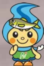
町のイメージキャラクター 「なかちゃん」