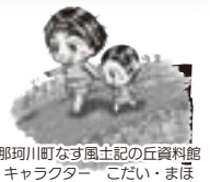
那珂川町なす風土記の丘資料館 キャラクター こだい・まほ

川崎古墳の石室は現在、崩落の危険があるため、一般公開はしていませんが、なす風土記の丘資料館には、実物大で復元した石室が展示されています。