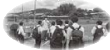
〈水産科の施設見学〉

“これまで”よりも“これから”を！ 馬頭高校は皆さんの “これから” を大切にします。