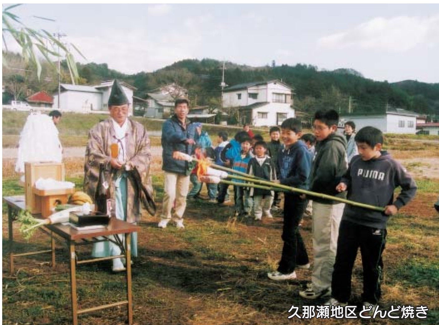
久那瀬地区どんど焼き

●発行／栃木県那珂川町議会 ●編集／那珂川町議会広報特別委員会 電話0287(96)2112 e-mail gikaigiji@town.tochigi-nakagawa.lg.jp