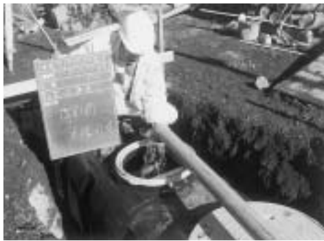
答弁（上下水道課長）

排水事業地区外の合併浄化槽設置や既存の単独浄化槽を合併浄化槽に転換する場合の事業者負担を軽減すべきと思うがどうか。