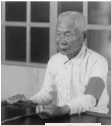
在宅健康管理システム資料から

（高度情報化推進室長） 健康管理システムは、健康のまちづくりの手段として非常に有効であると認識している。導入する行政サービスについては、住民の要望を把握して、費用対効果を十分に勘案した上で必要なシステムを導入したい。