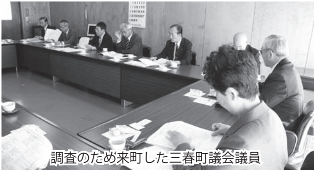
調査のため来町した三春町議会議員

現在、福島県三春町では、先の東日本大震災の影響により庁舎が破損し庁舎建設を進めていることから、当町の庁舎建設の状況について、総務課の担当者から説明を受けました。