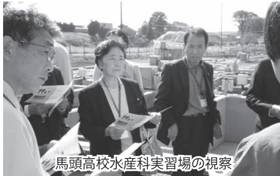
馬頭高校水産科実習場の視察