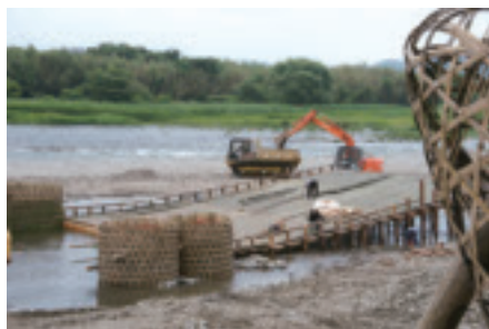
撮影地：高瀬観光やな