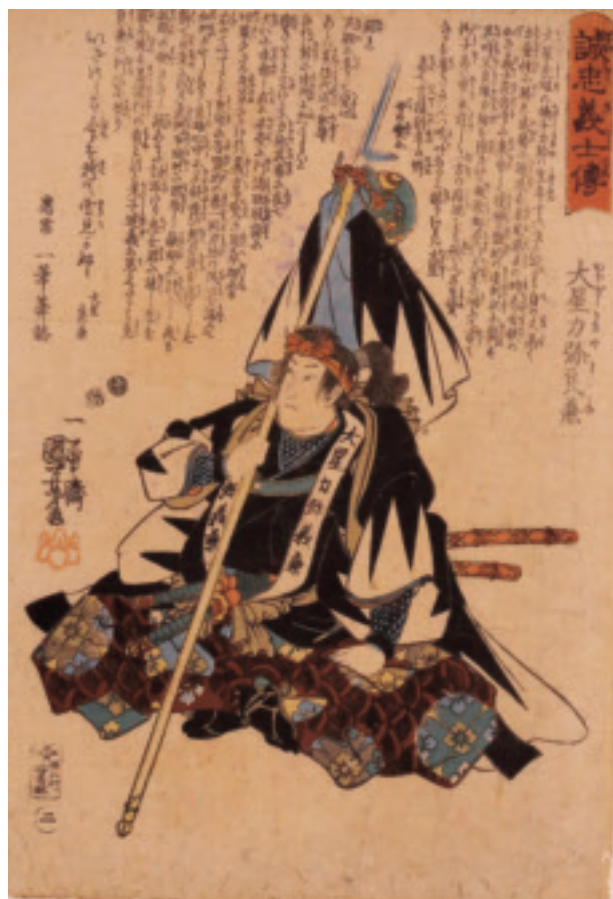
歌川国芳「誠忠義士傳 二 大星力弥良兼」

【会期】 ~令和2年1月13日(月祝) 【休館日】 12月16日、23日、28日 ~令和2年1月3日、6日