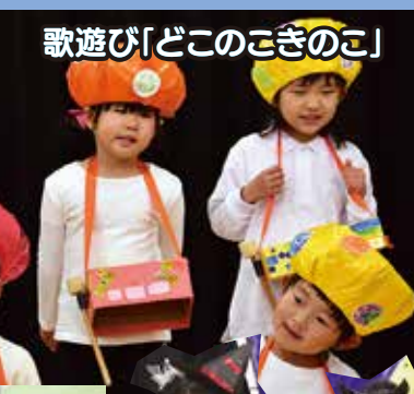
歌遊び「どこのこぎのこ」