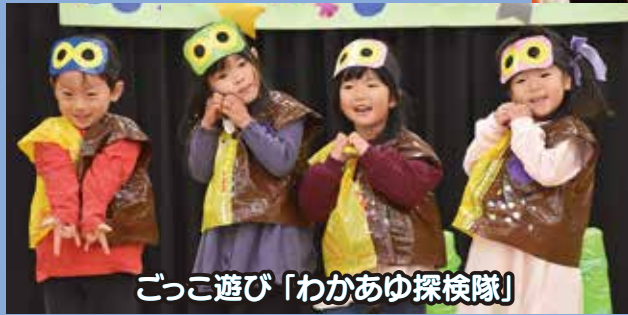
ごっこ遊び「わかあゆ探検隊」