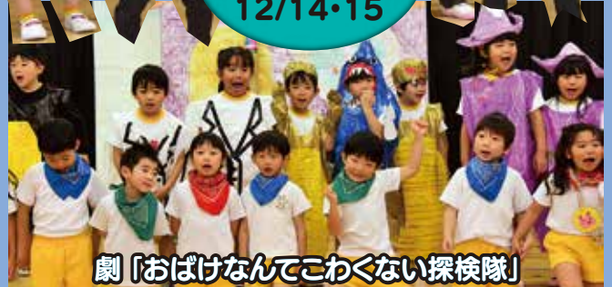
劇「おばけなんてこわくない探検隊」