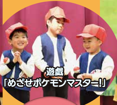
遊戯 「めざせポケモンマスター!!」