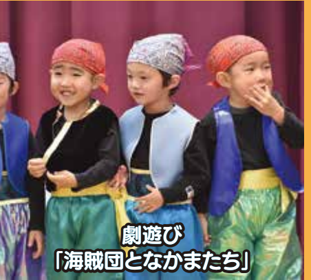
劇遊び 「海賊団となかまたち」