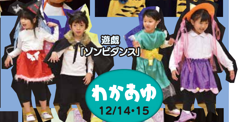
遊戯 「ゾンビダンス」