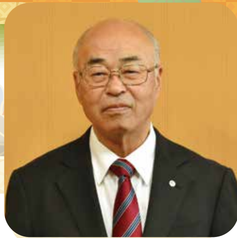
那珂川町長 福島 泰夫