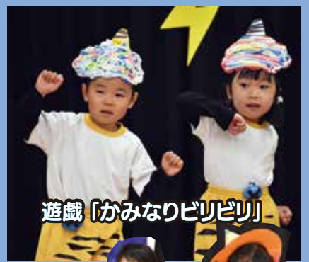
遊戯「かみなりビリビリ」