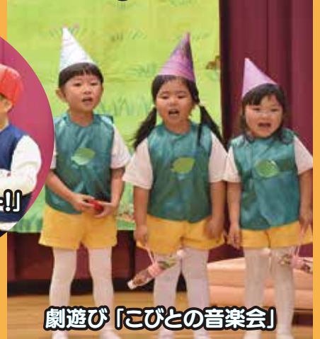
劇遊び「こびとの音楽会」