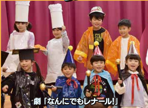
劇「なににでもレナール!!」