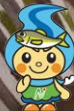
町のイメージキャラクター 「なかちゃん」