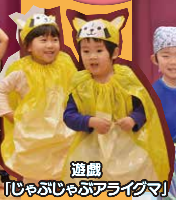
遊戯 「じゃぶじゃぶアライグマ」