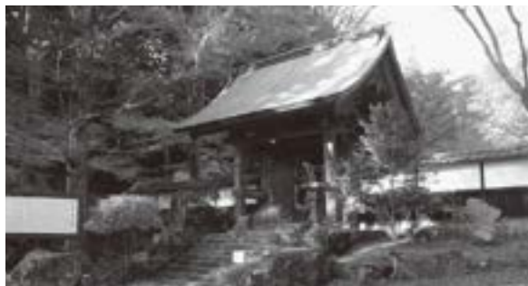
(昭和43年3月13日町指定文化財)

乾徳寺には山門の他、武茂氏の墓所などが整備されており、武茂氏の歴史に触れることができる場所となっています。