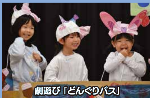
劇遊び「どんぐりバス」