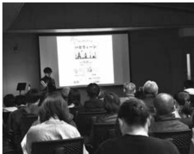
▲令和6年度開催の様子