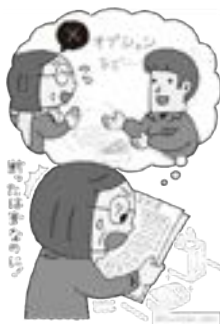
(独)国民生活センター「見守り新鮮情報」より

不安なときは、大田原市消費生活センターにご相談ください。(消費者ホットライン188)