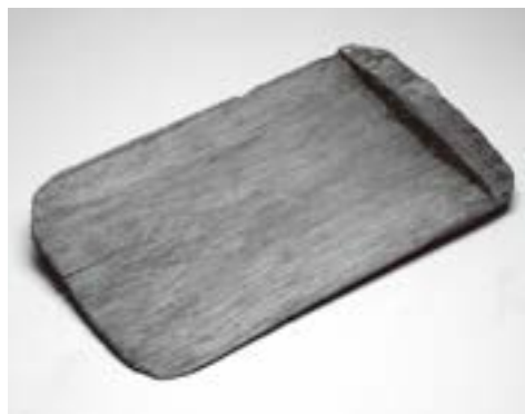
参考資料・ゆり板(北海道大樹町)