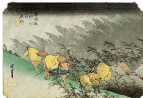
▲「東海道五拾三次之内」庄野(保永堂版) 天保4(1833)年、当館所蔵