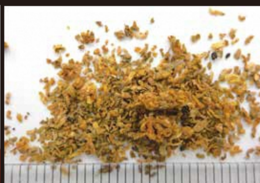
フラスの内容物にはノミで削ったような 薄い木くず片が含まれている