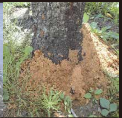
赤茶色のフラスが株元に積もったサクラ(左)とモモ(右)