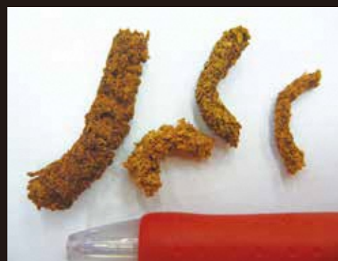
木くずと幼虫の糞が固まって かりんとう状となる