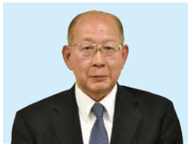
大金 清 公明党 現 (71) ③