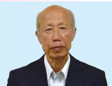
川俣 義雅 日本共産党 現 (77) ③