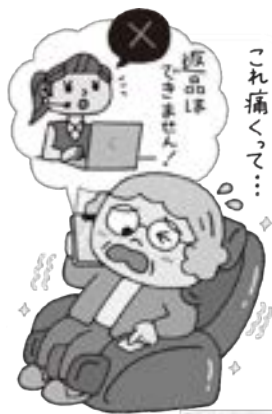
(独)国民生活センター「見守り新鮮情報」より

不安なときは、大田原市消費生活センターにご相談ください。(消費者ホットライン188)