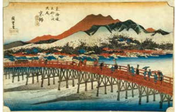
歌川広重《東海道五拾三次之内 大尾 京師 三条大橋》当館蔵

橋脚が木製で描かれていますが、実際の三条大橋は天正18(1590)年に豊臣秀吉が日本で初めて橋脚を石で造らせています。広重は自分のミスに気付いたのか、保永堂版から約10年後に出版された「東海道五十三次」(通称「行書東海道」・前期展示)では橋の上の様子を拡大して描き、橋脚を描いていません。その後、広重が晩年に制作した「五十三次名所図会」(通称「豎絵東海道」・前期展示)では、石造りの橋脚の三条大橋を描いています。本展示では、当館が所蔵する広重のさまざまな東海道シリーズを展示しておりますので、それぞれのシリーズの違いを楽しみながらご鑑賞ください。