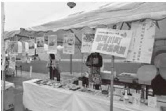
▲イベントでもブランド認定品は人気です！

那珂川町には、豊かな自然と歴史、そして人々が生んだ魅力あふれる特産品が数多くあります。町では、そうした地域の誇りを広く発信するため、優れた商品を「那珂川町ブランド認定品」として認定し、認定商品と町のイメージを高め、町の活性化を図っています。