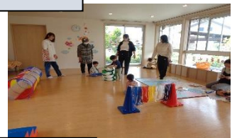
母の日のプレゼント作り