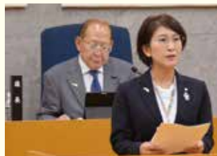
▲バッジを着用して定例会に臨む町長・議長

6月議会では、議員および執行部が、運動のシンボルである「幸福(しあわせ)の黄色い羽根」バッジを着用して意思表明を行いました。