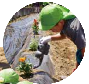
今月のショートムービー