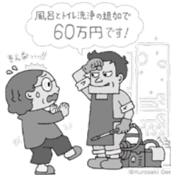
(独)国民生活センター「見守り新鮮情報」より

事業者によってサービス内容や料金は異なるため、必ず複数社から見積もりを取り、事業者の選定は慎重に行いましょう。料金や説明に納得できない場合は、きっぱりと契約を断りましょう。作業当日に追加の契約を勧誘されてもその場で決めないようにしましょう。困ったときは、大田原市消費生活センターにご相談ください。(消費者ホットライン188)