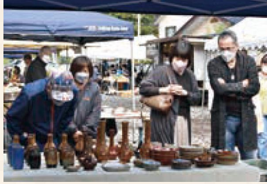
春と秋の年に2回開催される小砂焼陶器市