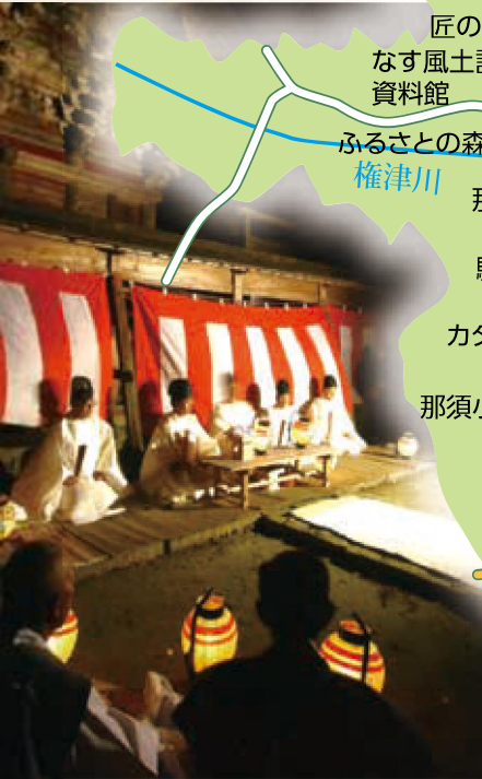
古式豊かな鷺子山上神社の夜祭