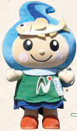
那珂川町のイメージキャラクター なかちゃん