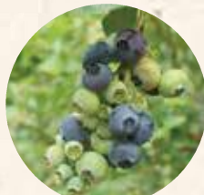
ブルーベリー 6月～7月